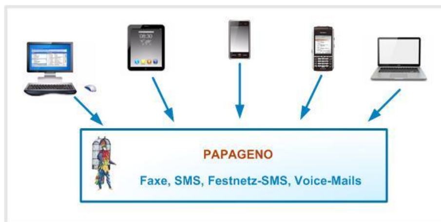
Abb.: Der Anwender kann über eine Vielzahl von Endgeräten und unterschiedlichen Applikationen auf den Unified-Messaging-Server zugreifen.

PAPAGENO ist beliebig skalier- und clusterbar. Pro Steckkarte sind 30 Leitungen (B-Kanäle) möglich. Die Anzahl der virtuellen, benutzerbezogenen Voice-Boxen wird ausschließlich von der Kapazität der verwendeten Server limitiert.